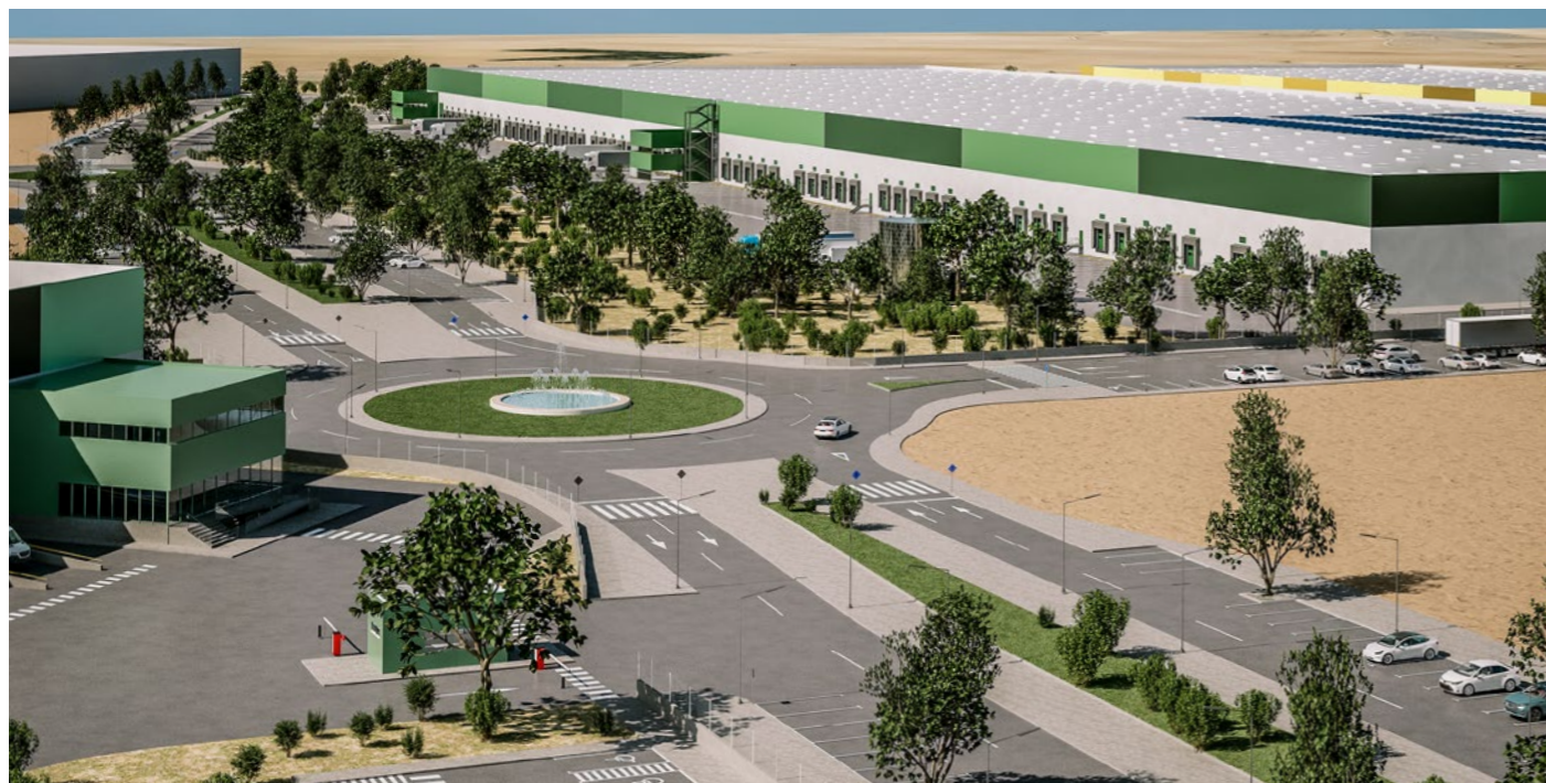
Se aprueba la construcción de una nueva rotonda de acceso al parque tecnológico logístico y la ampliación de la mejora de la n-400.